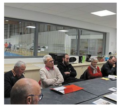
L'assemblée générale a réuni une quinzaine de membres